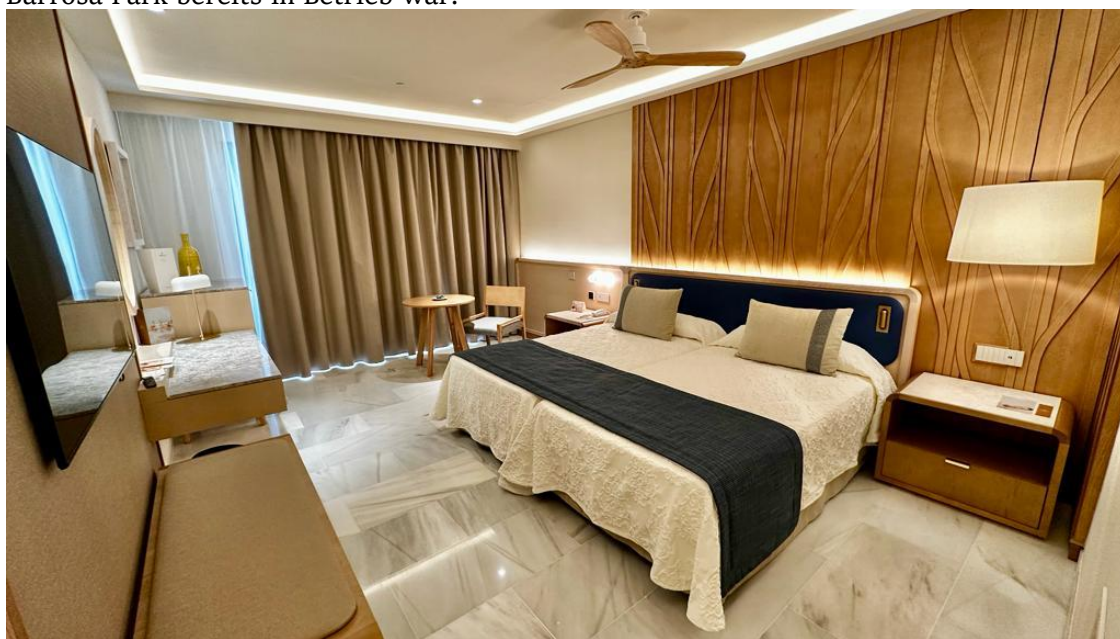
Aufnahme eines Hotelzimmers des Hipotels Barrosa Palace 5*

Ein weiteres Kernelement des Projekts war der Serena Beachclub , ein einzigartiger Ort, designt vom Designbüro Mister Wils als organisch-avantgardistisch geprägtes Projekt, ideal um direkt am Meer das Essen und die atemberaubenden Sonnenuntergänge, die die Costa de la Luz ausmachen, zu genießen. Es handelt sich bereits um den zweiten Beachclub der Hotelkette am La Barrosa Strand, an dem das „Calma Beach“ des Hipotels Barrosa Park bereits in Betrieb war.