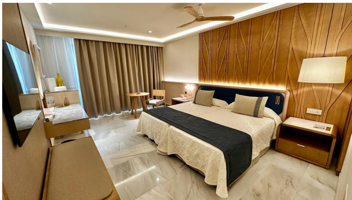
Imagen de las habitaciones del Hipotels Barrosa Palace 5*

Otra de las claves del proyecto ha sido el Serena Beach club, un espacio único, que ha contado con el estudio de diseño Mister Wils, que ha proyectado un diseño orgánico y vanguardista, perfecto para disfrutar en primera línea de mar de la gastronomía y de las incomparables puestas del sol que hacen única la costa de Cádiz. Este beach club se convierte en el segundo de la cadena en la playa La Barrosa, donde ya operaba el Calma Beach, del hotel Hipotels Barrosa Park.